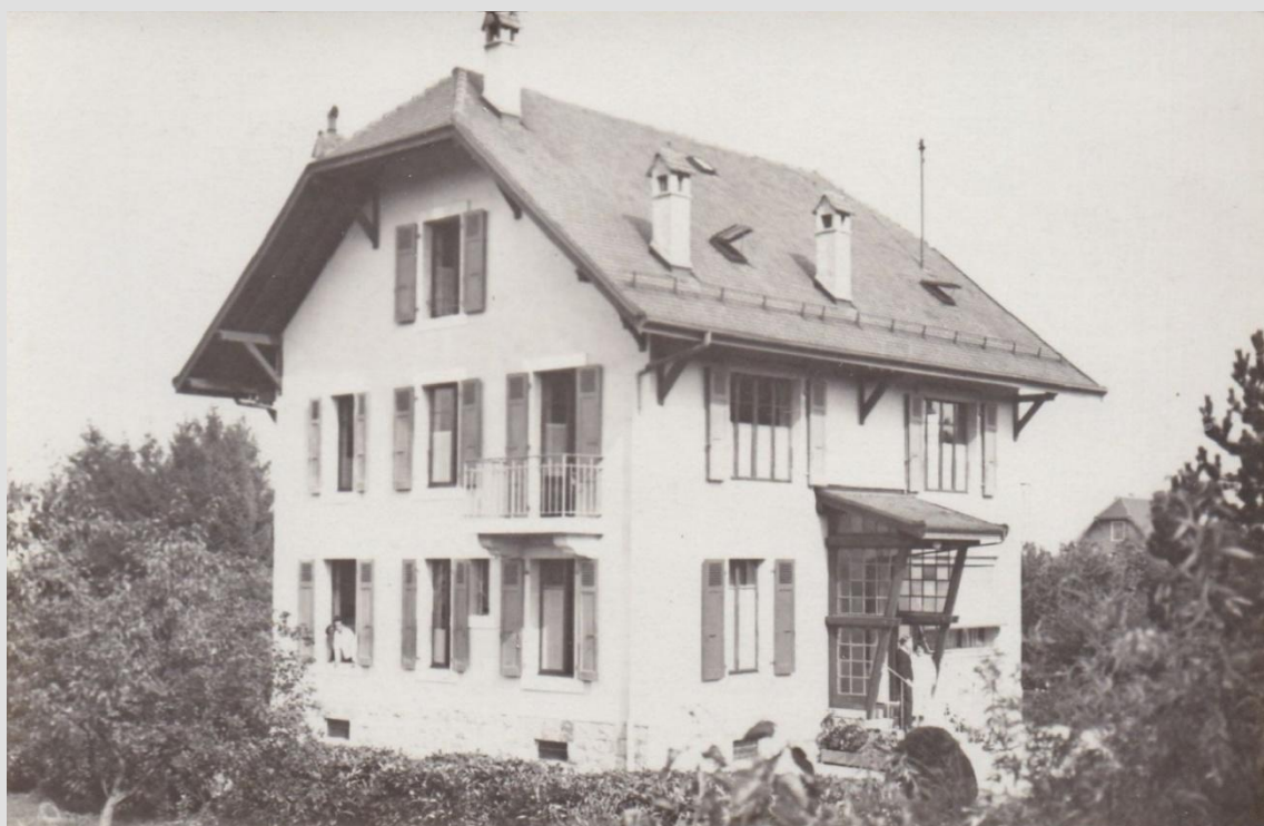
L'Institut Cappoen à la route des Fayards